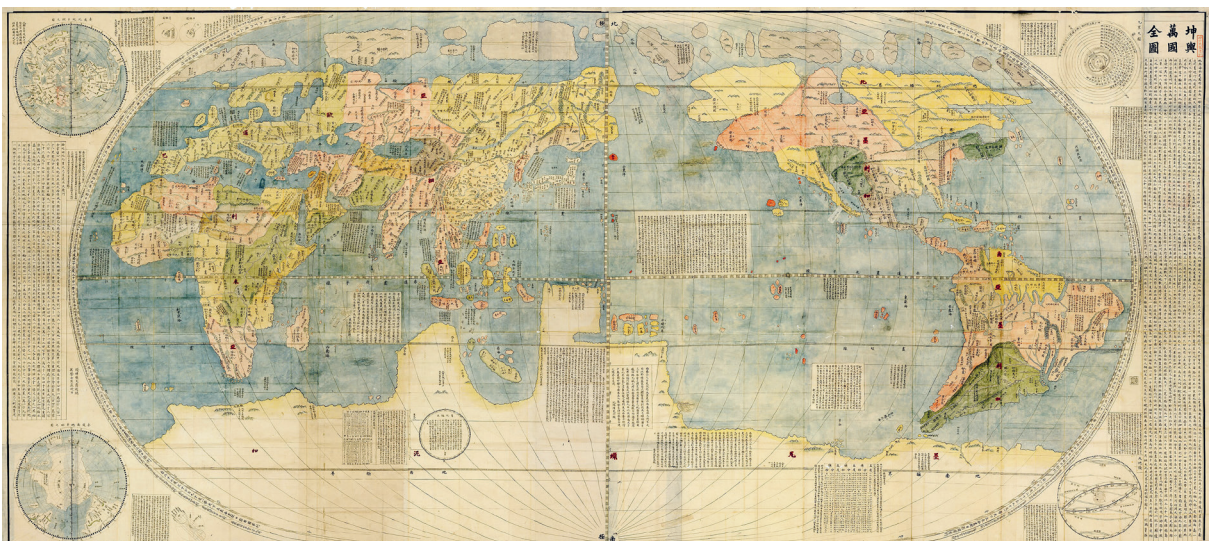
Die Weltkarte Kunyu Wanguo Quantu, gedruckt in China in 1602 von Matteo Ricci

Ist das nun plötzlich alles Rechtsgeschichte, wenn wir nicht nur in der Wirtschaft, sondern auch in Politik, Kultur und Recht so etwas wie ein decoupling erleben, die Suche nach Autonomie? Sind wir Zeugen eines epistemic decoupling ? Man könnte das denken. Trump wirft Europa vor, die europäischen Werte vergessen zu haben – und sieht sich als deren Bewahrer. Indien baut an einer nationalen Erzählung. In China fördert die Partei die Herausbildung eines sogenannten autonomen Wissenssystems, das auch für das Recht einem chinesischen Weg folgen soll. Lateinamerikanische und afrikanische Länder suchen nach ihrer postkolonialen Identität, und Europa sieht sich inzwischen als Systemrivale zu fast allen Regionen. Interessant ist dabei die Kraft des historischen Arguments: fast alle berufen sich auf ihre distinkten Traditionen.